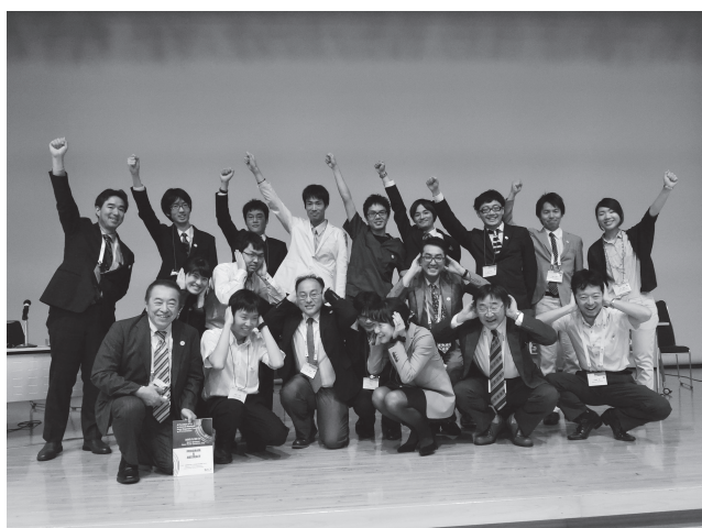
2015年 最終問題解答のポーズをとる参加者