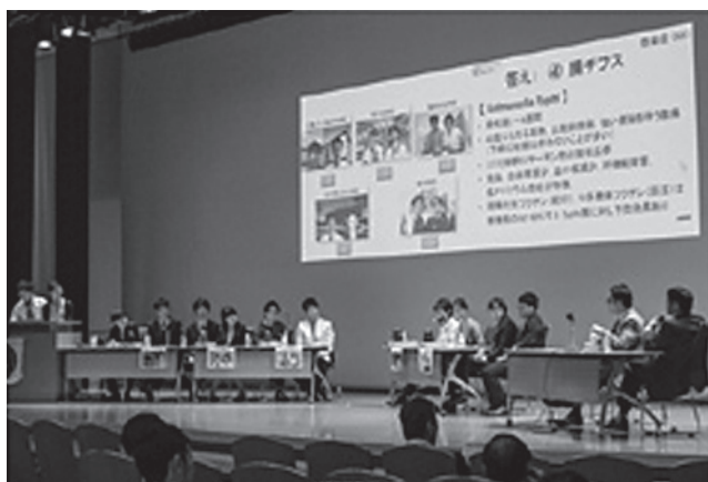
2015年 Dr's Dilemmaの様子