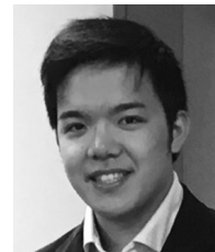
荘子 万能 Mano Soshi

Target Doctor, Senior Resident (3+years after graduation), Resident (1-2 years after graduation), Medical student